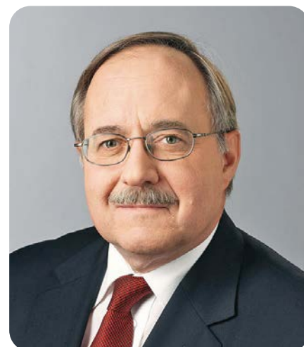
Samuel Schmid alt Bundesrat

Biel-Bienne und das Seeland sind solidarisch mit dem Emmental und dem Oberaargau!